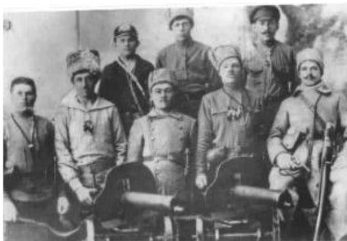
Пулемётная команда Красной гвардии, с. Сидоры, 1918 г.