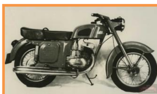
Восход K-175 середина 60-е