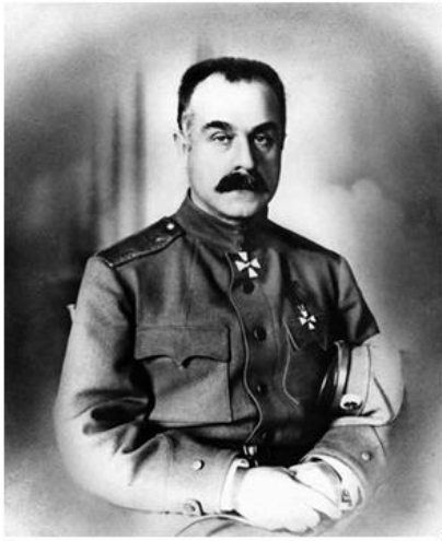
КАЛЕДИН АЛЕКСЕЙ МАКСИМОВИЧ