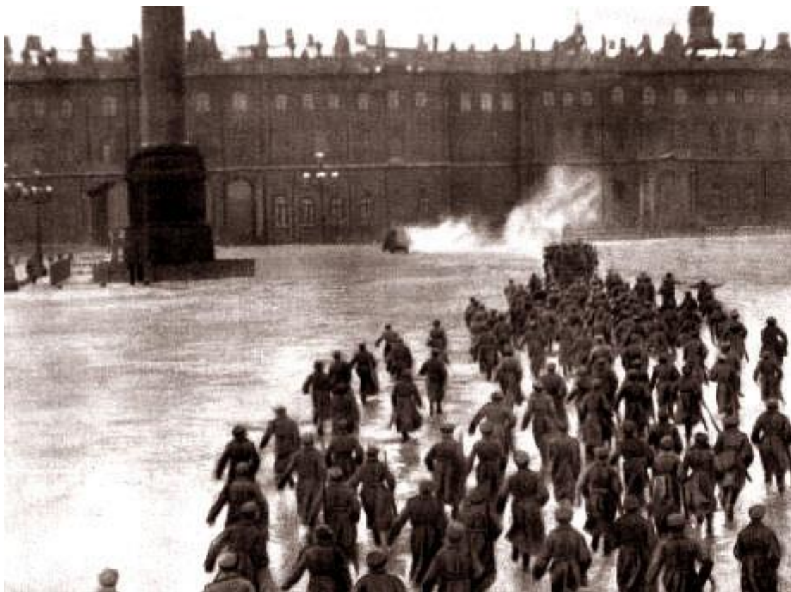
Восстание большевиков 1917 год

этапах революции 1917 г. - от Февральской к Октябрьской - казачество в силу объективных причин проявляло значительные колебания по вопросу определения своей политической позиции.