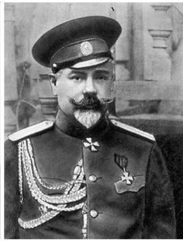
ДЕНИКИН АНТОН ИВАНОВИЧ