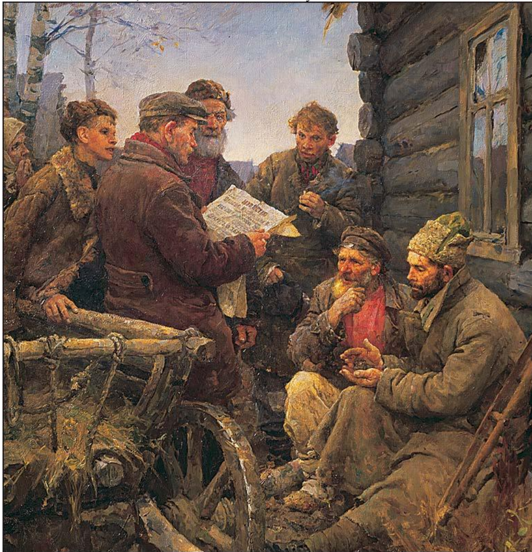
«Декрет о земле». Художник В.А. Серов. 1957 г.

Причиной первых столкновений стали земельные споры: областной съезд крестьянских депутатов объявил всю землю общественной, отменив тем самым частную собственность на личные наделы.