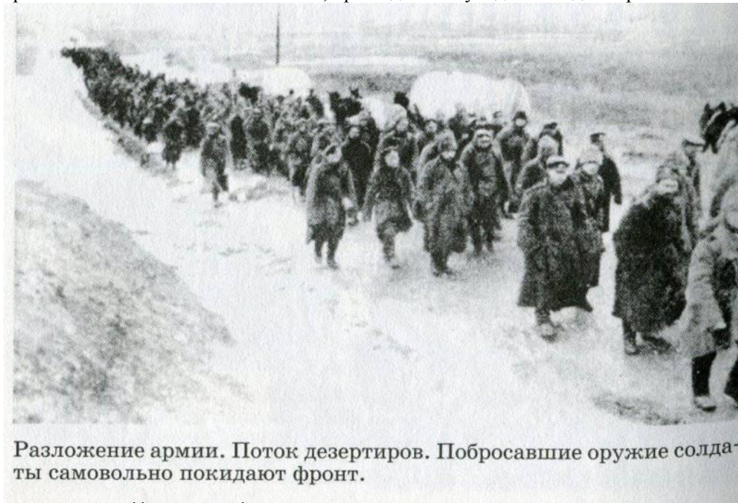
Разложение армии. Поток дезертиров. Побросавшие оружие солдаты самовольно покидают фронт.

Сведения о революции в России в хутора Верхнего Дона принесли солдаты-фронтовики, бросившие фронт, и поодиночке, а то и целыми сотнями, добравшиеся домой. Прибывшие домой, открыто заявив нейтралитет, принялись за восстановление своего, пришедшего в упадок за годы мировой войны, хозяйства.