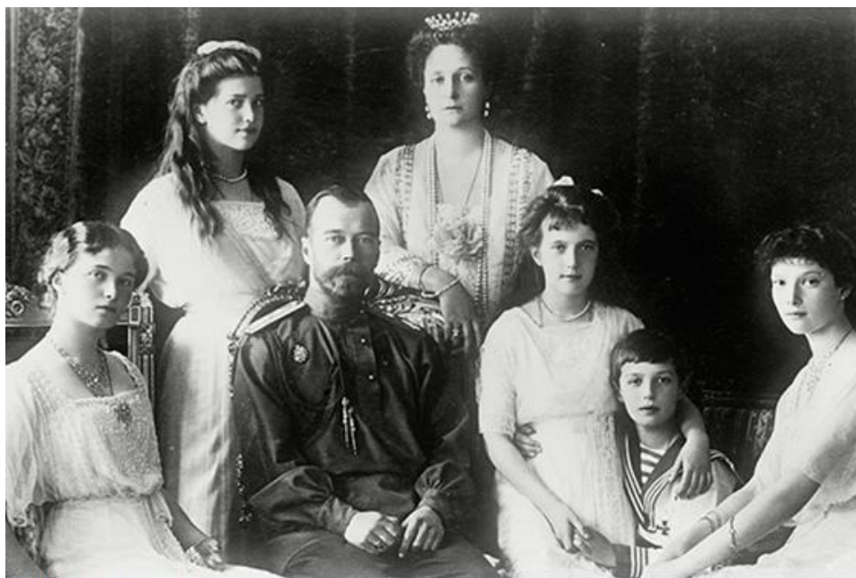
Николай II с семьей

Известие о свержении, а затем и убийстве монарха стало потрясением для казаков Дона, для которых основным занятием была служба Отечеству.