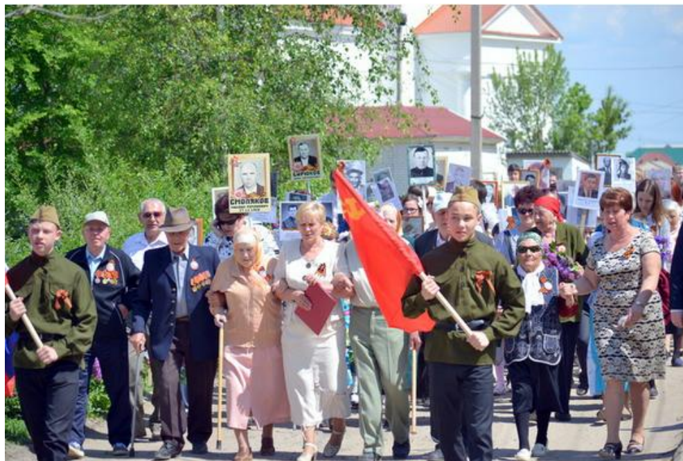
Фото: поселок Себрово День Победы