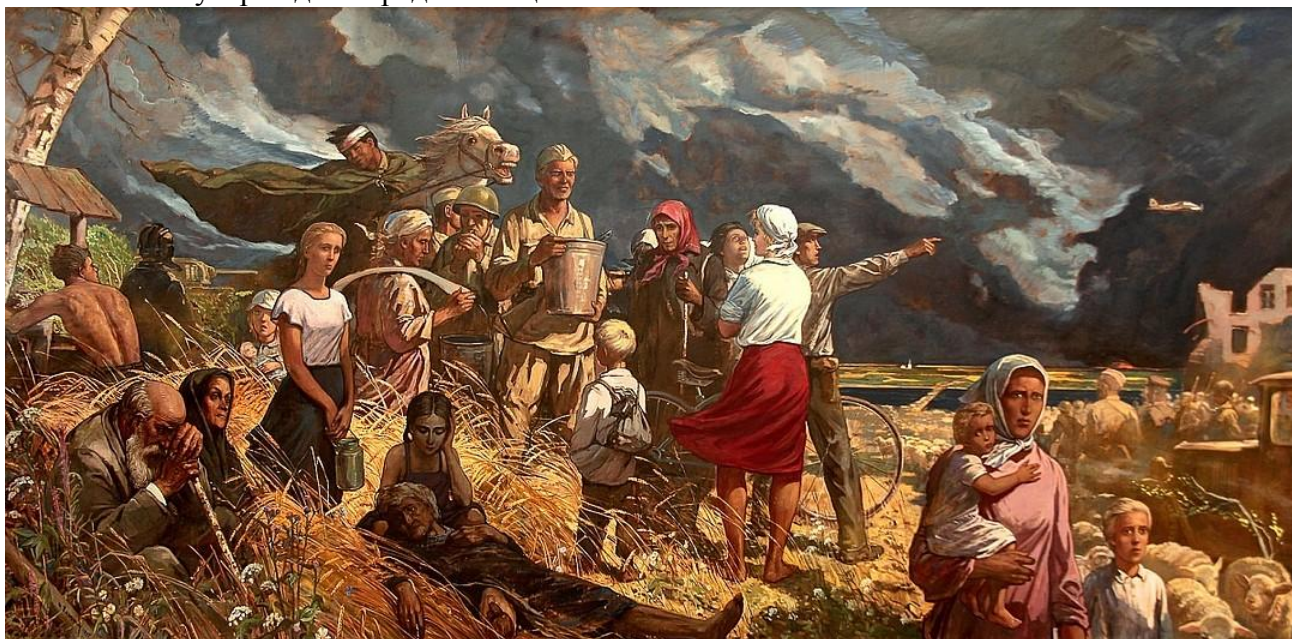
Рис: «Дороги войны» И.С. Глазунов

Воинские части двигались через Михайловский район к Дону, волге, к Сталинграду. Останавливались в хуторах для передислокации.