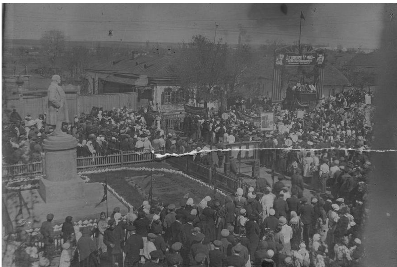
Михайловка 22.06.1941 г. архивное фото

22 июня 1941 года черная дата в нашей истории. Сколько бы мы не говорили о трагедии, вряд ли мы сможем реально представить себе, что чувствовали 77 лет назад наши родные, прослушав сообщение о начале войны. Боль расставания пронзила их сердца. Тревога за самых близких сковала душу.